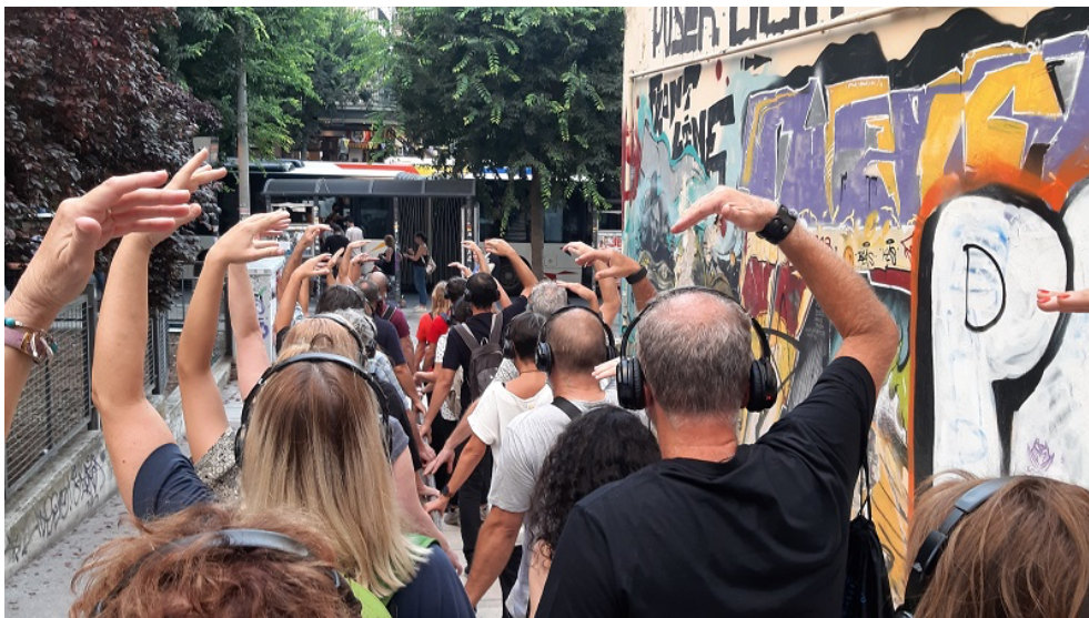
Dans la rue, en position de ballet.

mannequins ou danser sur une place devant tout le monde, nous évoluons en une sorte de « spect-acteurs », agissants mais pas vraiment autonomes. À part la porosité des frontières entre la performance théâtrale et le monde réel, ce qui est également exploré à travers ces microactions guidées, ce sont les limites de notre obéissance à des règles et consignes émanant d'une autorité extérieure non identifiée, ainsi que la place et la fonction de l'individu à l'intérieur du groupe. Grâce à la technologie des casques audio, qui isolent et relient à la fois, les participants forment une communauté temporaire, au sein de laquelle se tissent des rapports de solidarité et de confiance, mais aussi de concurrence ou de force. On est ensemble, on se partage les mêmes « missions » et le même espace public, on marche l'un à côté de l'autre, mais qui précède, qui suit et qui arrive le dernier ? Dans quelle mesure est-ce qu'on accepte ou on met en question la logique et le pouvoir des algorithmes qui nous guident ? Et quelles seront les conséquences pour le groupe (et pour le spectacle) si un de ses membres adopte des conduites déviantes ?