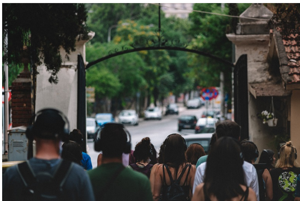
À la sortie du cimetière, prêt(e)s à redécouvrir la ville.

Nous voilà donc immergés, dès les premières minutes, dans l'univers singulier de Remote Thessaloniki , une promenade acoustique proposée par le collectif Rimini Protocoll, dans le cadre du 3 e Festival international de la Forêt, organisé par le Théâtre National de la Grèce du Nord. Le projet, qui a déjà connu plusieurs versions internationales sous le titre Remote X (X= Vilnius, Le Havre, Lausanne, Belgrade, Copenhague, etc.), s'avère un choix idéal en temps de pandémie, car il se déroule à l'extérieur, permettant ainsi aux spectateurs de garder les distances de sécurité. Nouvel accessoire obligatoire, à part les casques audio : le masque.