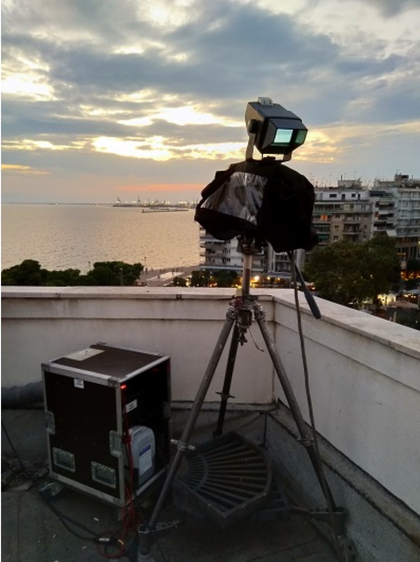
L'étape finale : sur le toit du Théâtre national de la Grèce du Nord.

Nous quittons progressivement l'église, divisés en trois sous-groupes. Quelques instants après, notre parcours s'achève de manière spectaculaire sur le toit du Théâtre national de la Grèce du Nord, d'où nous admirons la vue panoramique de la ville au moment du coucher du soleil. Mais, enfin, à quoi exactement avons-nous participé ? C'était un jeu immersif, un atelier de découverte urbaine ou une allégorie sur ce qui constitue l'humanité de l'homme ? Une performance sensori-motrice et multimodale ou une expérimentation d'anthropologie sociale ?