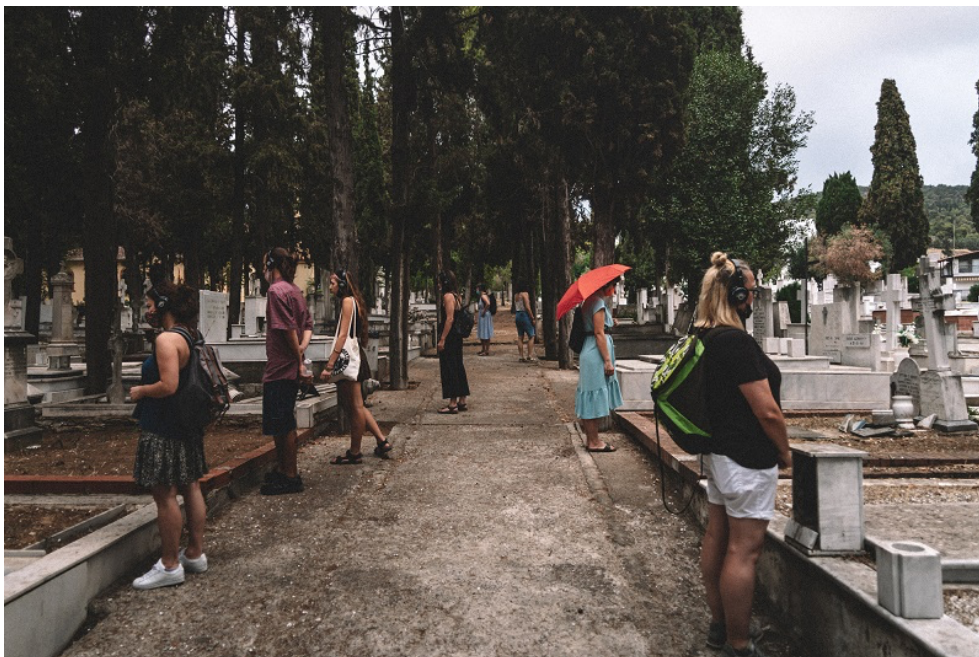
Confronté(e)s à la mélancolie du cimetière.

Nous portons nos casques audio – nous sommes à peu près 25-30 personnes – et l'« aventure » commence par une déambulation contemplative parmi les tombes et les statues funéraires de ce lieu symbolique. Une voix féminine, calme et suggestive, nous guide, chuchotant – en grec – à nos oreilles des pensées mi-macabres, mi-ludiques sur la vanité de l'existence, le destin du corps humain et les fonctions de la mémoire. Elle se présente : elle s'appelle Mélina, mais elle n'existe pas dans le monde réel, elle est « synthétique », générée par un programme d'intelligence artificielle. Elle nous incite ensuite à former un groupe ; c'est grâce à elle que nous demeurerons « connectés » pendant les 100 minutes de notre promenade. Suivant ses instructions, nous nous dirigeons vers la sortie du cimetière pour continuer notre parcours en plein centre-ville.